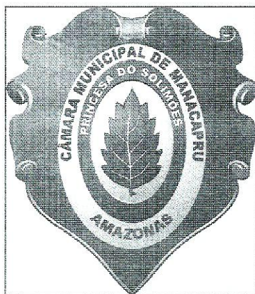
Escala de cinza