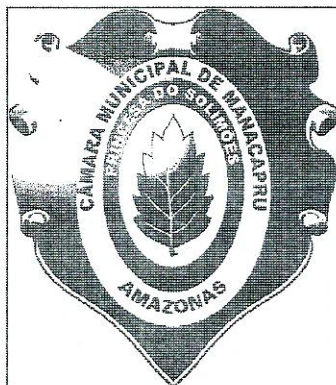
Preto e branco